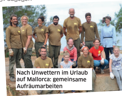
Nach Unwettern im Urlaub auf Mallorca: gemeinsame Aufräumarbeiten

Lisa Gärtner – online: Unter www.abgeordnetenwatch.de