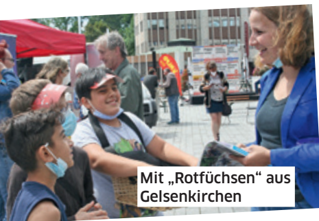
Mit „Rotfüchsen“ aus Gelsenkirchen

mich mit Rückgrat, Selbstlosigkeit und Engagement auch im anti-kommunistischen Gegenwind für die Zukunft einzusetzen. So organisierte ich 2001 als Schülersprecherin eine Protestaktion gegen den Bundeswehreinmarsch in Afghanistan. Ich engagiere mich in der Genossenschaft für Nachbarschaftsinteressen. Mit meinem Verlob-