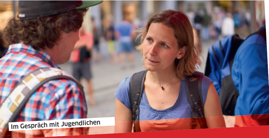
Im Gespräch mit Jugendlichen