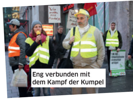
Eng verbunden mit dem Kampf der Kumpel