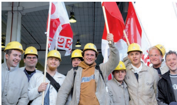
Des apprentis du secteur minier manifestent leur solidarité dans la lutte pour les postes de travail.