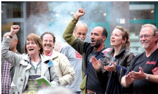
Rassemblement pendant la campagne électorale au Bundestag en 2013