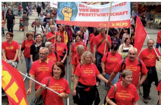
Les initiatives électorales servent aussi à contrôler les candidats