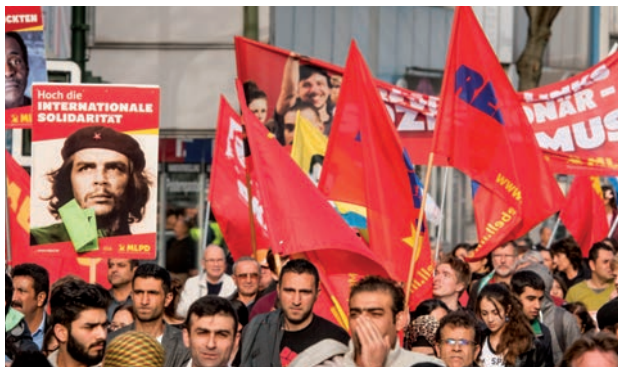
Soutien des réfugiés dans la lutte commune