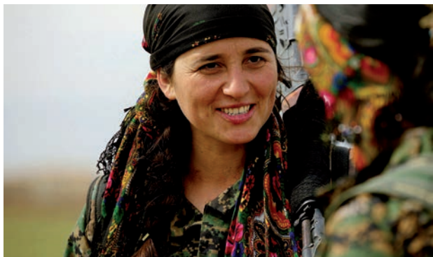
Des femmes kurdes des YPJ (Unités de défense des femmes) au Rojava / Syrie du Nord