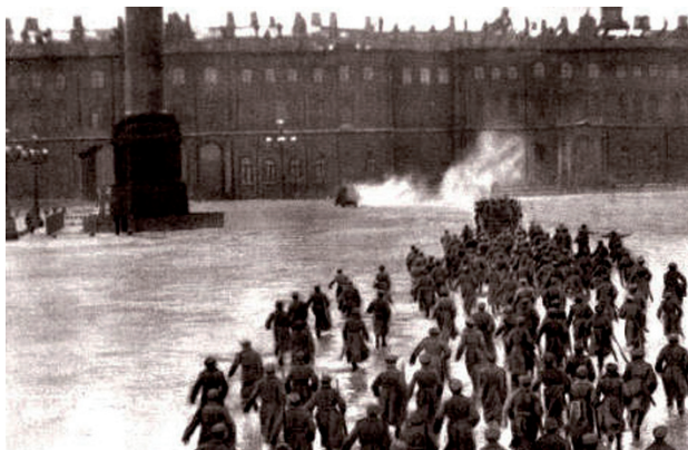
Révolution d'Octobre en 1917 en Russie : Assaut du palais d'Hiver