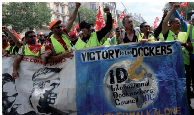
Les dockers d'Europe ont lutté avec succès contre la directive « Port Package » de l'UE. Ici : des dockers à Paris en 2016