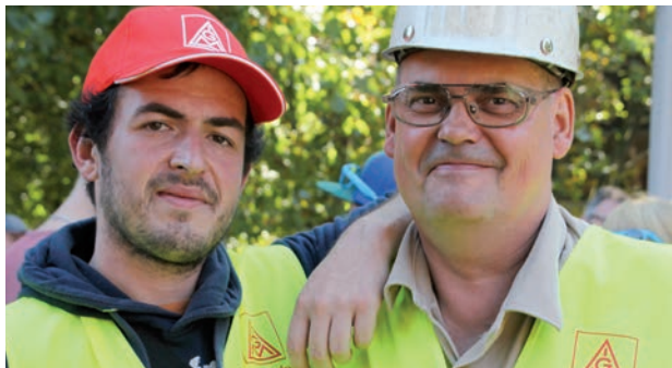
Sidérurgistes lors d'une journée d'action du syndicat métallurgique à Duisburg en 2016

Le travail quotidien marxiste-léniniste dans les entreprises et les syndicats parmi les ouvrières, les ouvriers ainsi que les employés et les apprentis des grandes entreprises dans l'industrie, la logistique, la communication et dans les centres de