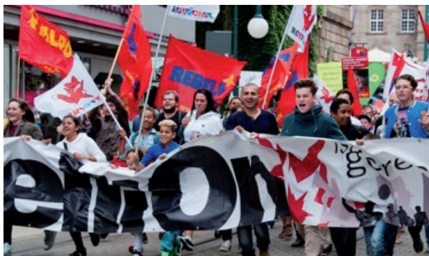
L'organisation des jeunes Rebell en action