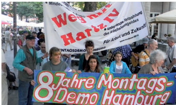
En 2004, les manifestations du lundi contre les lois Hartz ont commencé qui continuent d'avoir lieu dans beaucoup de villes en Allemagne.