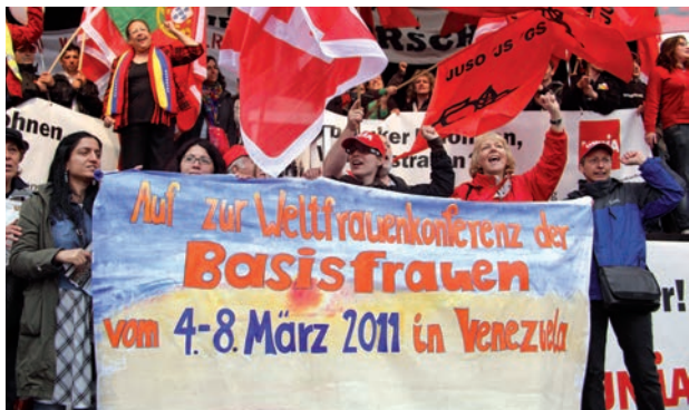
Pouvoir des femmes : Des Conférences mondiales des femmes de la base eurent lieu avec succès au Venezuela (2011) et au Népal (2016).