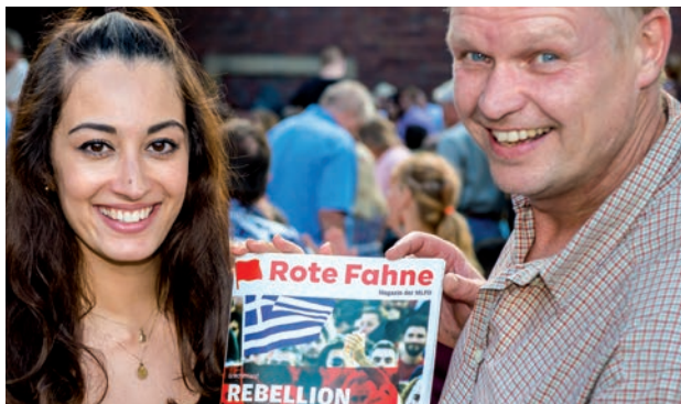
Rote Fahne, l'organe central du MLPD, paraît depuis plus de 45 ans.

pourront pas se libérer de l'exploitation et de l'oppression capitalistes.