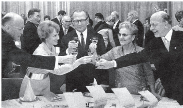
Erich Honecker (au milieu) et Walter Ulbricht (à droite) : Représentants de la nouvelle bourgeoisie dans l'ancienne RDA

sûreté de l'État. On fut mis sous tutelle ou mené par le bout du nez de façon bureaucratique, un climat de peur d'espionnage et de dénonciation fut engendré.