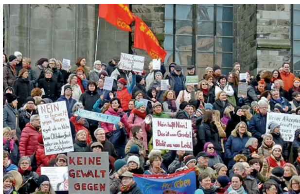
Protestation contre la violence faite aux femmes et contre le racisme à Cologne en 2016