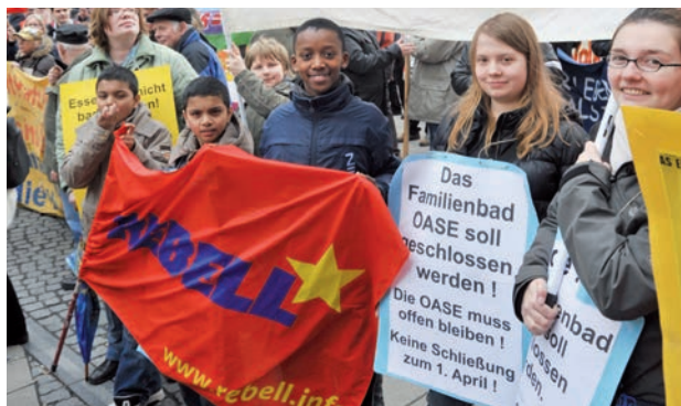
Actifs pour les intérêts des masses