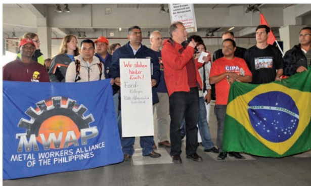
Solidarité internationale parmi les ouvriers de l'automobile