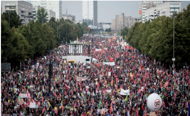
Manifestation de masse à Berlin 2016 contre l'accord de libre échange TTIP planifié