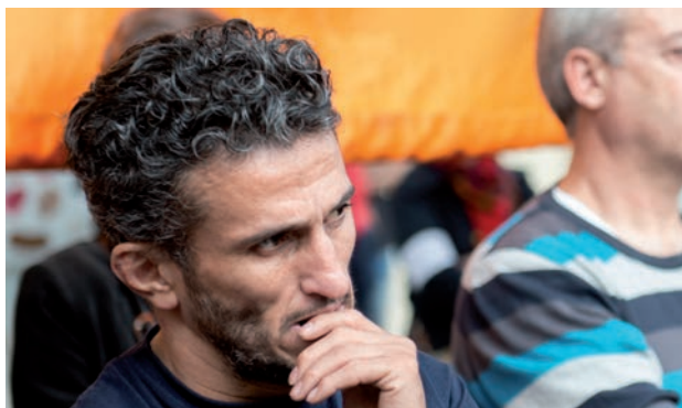
Des cours pour apprendre la méthode dialectique sont conçus pour permettre une orientation autonome aux membres et aux masses.