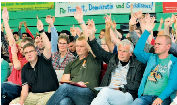
Congrès électoral de l' « Alliance internationaliste » à Berlin en 2016