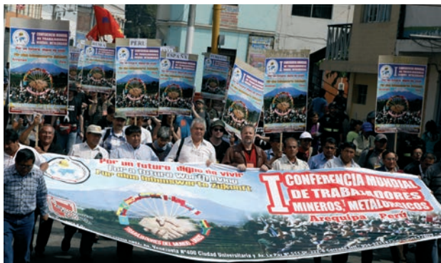
Assemblée ouvrière et manifestation à la 1ère Conférence internationale des mineurs à Arequipa/Pérou