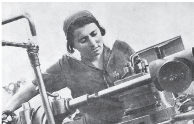
La construction du socialisme en Union soviétique dans les années 1920