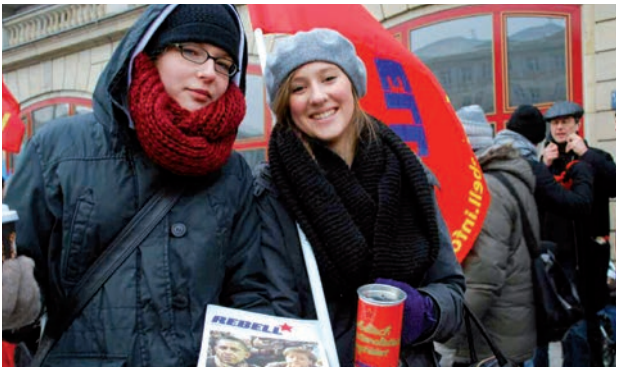
Le MLPD et Rebell financent leur travail avec la cotisation des membres et par des dons.