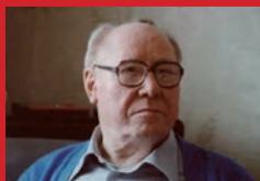
Willi Dickhut Dirigeant de la rédaction Revolutionärer Weg jusqu'à 1992

Willi Dickhut, maître à penser et co-fondateur du MLPD, à propos de l'importance fondamentale de cette série : « Chaque numéro traite un problème déterminé central de notre époque et tous ensemble constituent un système pour la solution pratique des tâches actuelles. Le contenu de notre organe théorique n'est pas une étude théorique abstraite mais une unité dialectique des principes marxistes-léninistes et d'expériences pratiques du travail communiste de plusieurs dizaines d'années. Sur la base du marxisme-léninisme, nous avons analysé dans Revolutionärer Weg les changements de l'époque actuelle, gagné et développé théoriquement de nouvelles connaissances. »