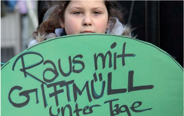
Protestation contre le stockage de déchets toxiques dans les mines