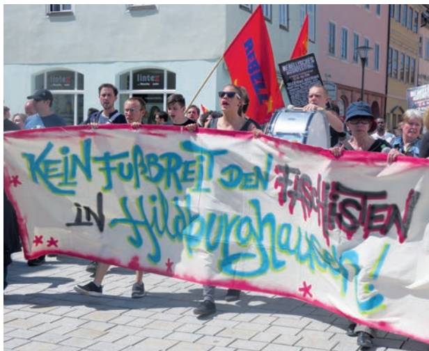
Manifestation antifasciste à Hildburghausen en 2016, initiée par l'organisation des jeunes Rebell

Les monopoles et des parties de l'appareil d'État et des masse média soutiennent les néofascistes comme troupe de choc et réserve contre des mouvements révolutionnaires et des luttes ouvrières. L'appel à la haine et les attaques contre des personnes d'autres nationalités et couleurs de peau, contre des minorités, des antifascistes et des révo-