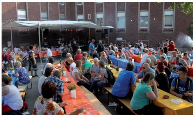
Célébration commune à la fête annuelle de « Horster Mitte » à Gelsenkirchen – également le siège de la centrale du MLPD.