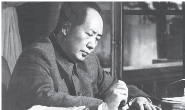
Mao Zedong – Révolutionnaire et théoricien du marxisme-léninisme