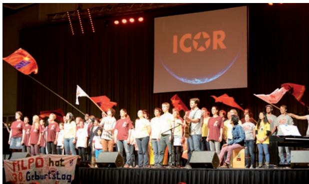
Grand événement à l'occasion de « 30 ans du MLPD » en 2012