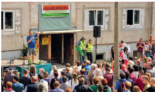
Fête du bouquet de la « Maison de solidarité » à Truckenthal/Thuringe en 2016