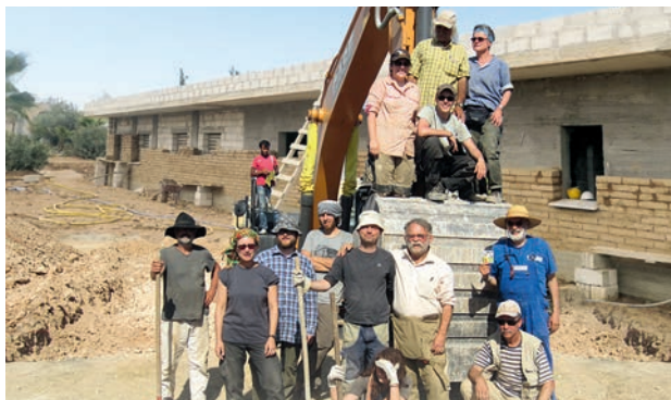
Pacte de solidarité de l'ICOR : Construction d'un centre de santé à Kobanê / Syrie du Nord par des brigades internationales en 2016

Le MLPD incarne une politique prolétarienne à l'égard des réfugiés. Il s'engage pour l'organisation commune dans le MLPD, dans l'organisation révolutionnaire de la jeunesse Rebell et dans les diverses auto-organisations des masses de caractère ueberparteilich [non-lié à un parti].