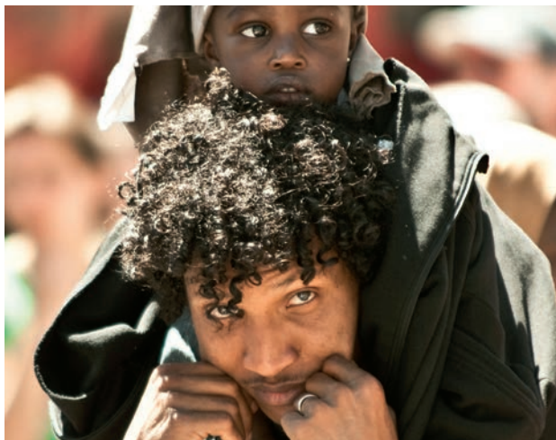
Des dizaines de millions en fuite : Des opprimés du système impérialiste mondial