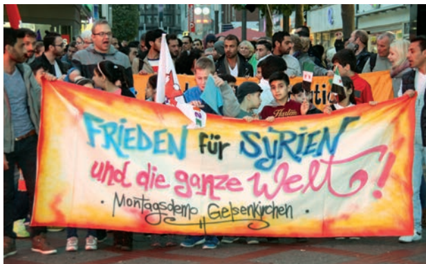
« Paix pour la Syrie et le monde entier », manifestation à Gelsenkirchen