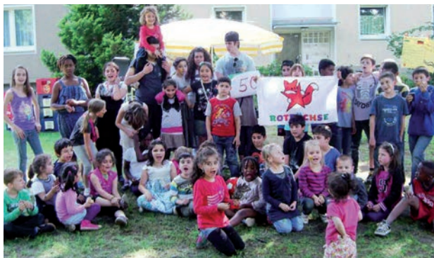
Rotfüchse sont l'organisation d'enfants du MLPD