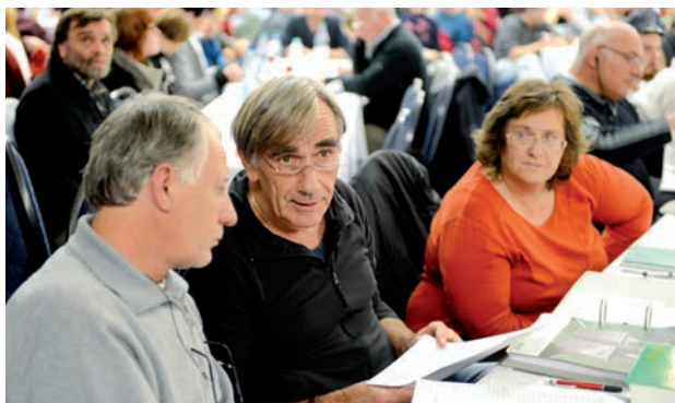
Séminaire d'Europe des MLPD et ICOR en 2012