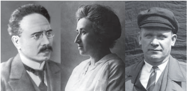
Sous la direction de Rosa Luxemburg et Karl Liebknecht le KPD fut fondé. Ernst Thälmann le dirigea à partir des années 1920 jusqu'à son arrestation et assassinat par les fascistes hitlériens.