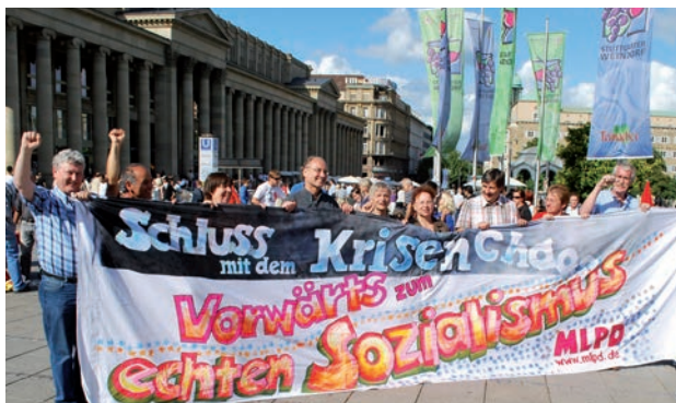
Rassemblement du MLPD à Stuttgart en 2009