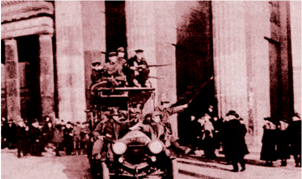
Révolution de novembre en 1918 en Allemagne : des milices ouvrières à la Porte de Brandebourg