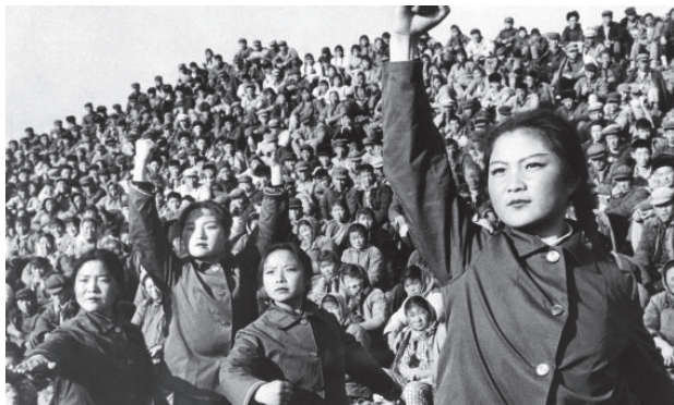
Représentation culturelle lors d'un rassemblement de masse pendant la Grande Révolution culturelle prolétarienne