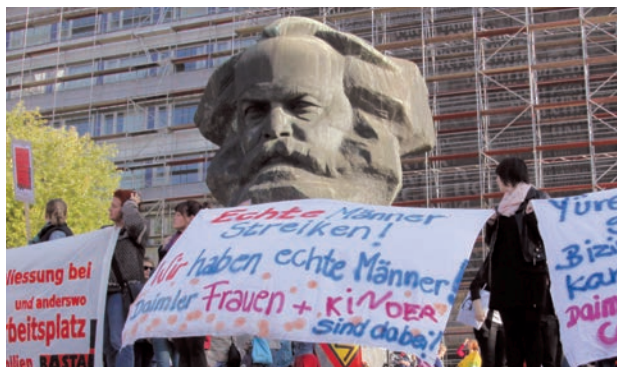
Manifestation au monument de Karl Marx à Chemnitz