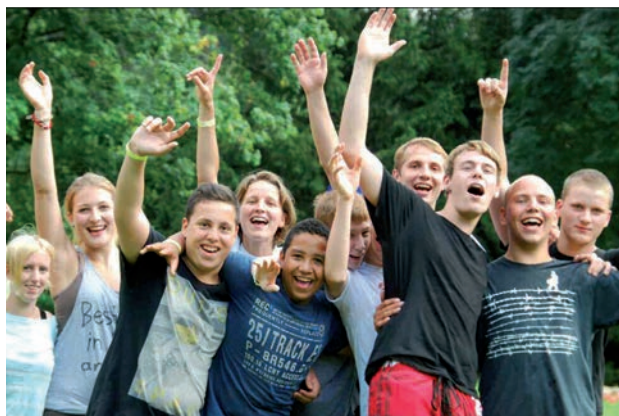
Camp d'été de Rebell