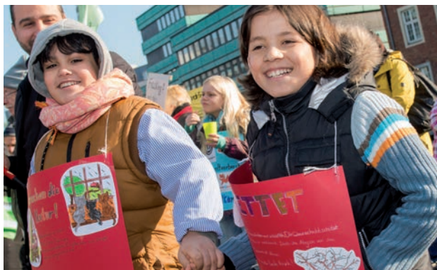
Des enfants de Rotfuchs en action pour sauver l'environnement naturel