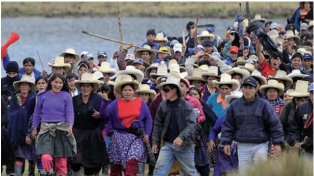
Protestation au Pérou contre la destruction de l'environnement par la mine d'or Newmont Mining