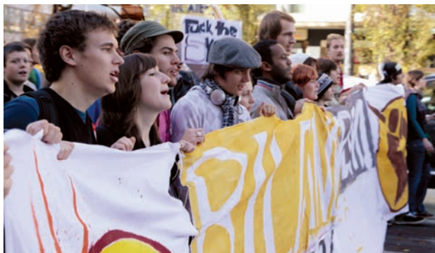
Protestations d'étudiants contre les frais d'enseignement