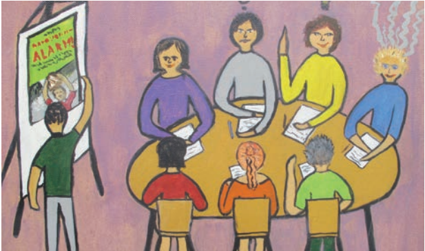
Dans la cellule se discute le travail quotidien et a lieu la formation des membres.