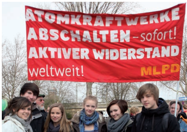
Protestations pour la fermeture de toutes les centrales nucléaires en 2011