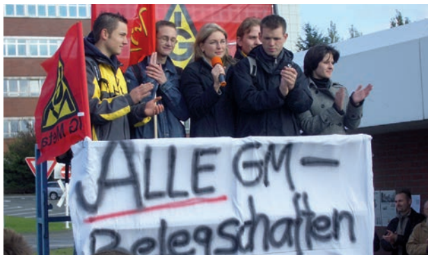
La grève autonome du personnel de Opel à Bochum en 2004 reçoit un grand soutien.