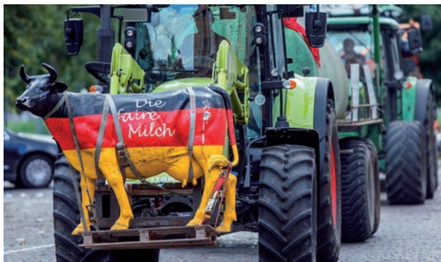
Producteurs laitiers luttent contre leur ruine, en commun et à l'échelle européenne