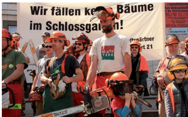
Jardiniers paysagistes contre le grand projet ferroviaire Stuttgart 21