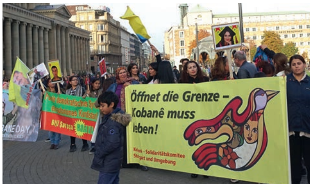
Solidarité avec la lutte de libération kurde au Rojava / Syrie du Nord