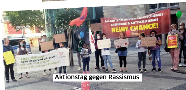
Aktionstag gegen Rassismus