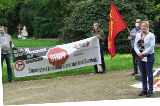
Gedenken am Mahnmal der sowjetischen Kriegstoten Dortmunder Hauptfriedhof am 8. Mai – Dem Tag der Befreiung vom Hitlerfaschismus.

Ich lade alle Dortmunder und Dortmunderinnen ein, sich an unserer Wahlkämpferbewegung zu beteiligen.