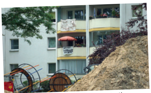
HOWOGE-Mieter Atzpodienstraße protestieren

In den letzten neun Jahren ist die durchschnittliche Wohnungsmiete in Berlin um mehr als 50 Prozent gestiegen und liegt inzwischen bei über 10 Euro pro qm. Ursache ist die kapitalistische Profitwirtschaft, in der alles zur Ware wird, auch das Wohnen. Die Mieten müssen begrenzt werden! Bis 2030 sollen 194 000 Wohnungen gebaut werden. Dafür dürfen keine Kleingartenanlagen, Waldgebiete oder andere Grünflächen zerstört werden, auch nicht am Tempelhofer Feld! Stattdessen sollen Baulücken geschlossen, Dächer ausgebaut, frühere Industriegebiete genutzt oder leer stehende Gebäude saniert werden.