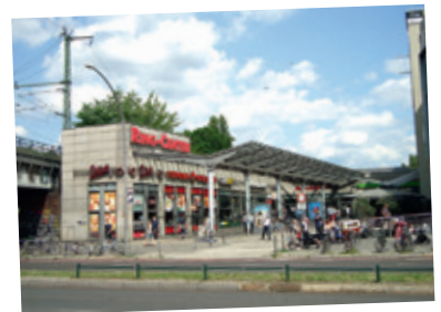
Geplante A100-Trasse zwischen S-Bahn und Ring-Center

Mit der internationalen Ausschreibung in mehreren Losen hat der Senat den Weg für die Privatisierung und Zerschlagung der S-Bahn freigemacht. Würden für den Bau neuer Wagen, die Instandhaltung und den Betrieb von Teilnetzen mehrere Firmen zuständig, ist ein Chaos vorprogrammiert. Aber auch Lohndumping, Verschlechterung der Arbeitsbedingungen, Preiserhöhungen und schlechterer Service sind zu befürchten. Die Übernahme der S-Bahn-Berlin GmbH, die heute der Deutschen Bahn gehört, in eine landeseigene Gesellschaft würde bessere Voraussetzungen schaffen, um die S-Bahn als Ganzes zu erhalten!