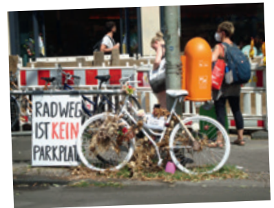
Tödlicher Fahrradunfall Frankfurter Allee

Ich lehne den Weiterbau der A100 durch Treptow und Lichtenberg ab, weil das noch mehr Autoverkehr in die dicht bebauten Wohngebiete zieht! Die Forderung nach Streichung aus dem Bundesverkehrswegeplan und Rückbau des 16. Bauabschnitts zu einer Stadtstraße ist genau richtig. Stattdessen muss der ÖPNV kostenlos sein, wie es auch ver.di fordert! Um die Radwege sicher zu machen, ist eine weitgehende Trennung vom Autoverkehr mit Fahrradstraßen wie die Linienstraße in Mitte notwendig. Dann werden die mit dem Fahrrad Fahrenden vor Abgasen und vor Unfällen geschützt.