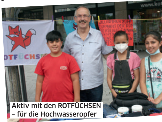
Aktiv mit den ROTFÜCHSEN - für die Hochwasseropfer