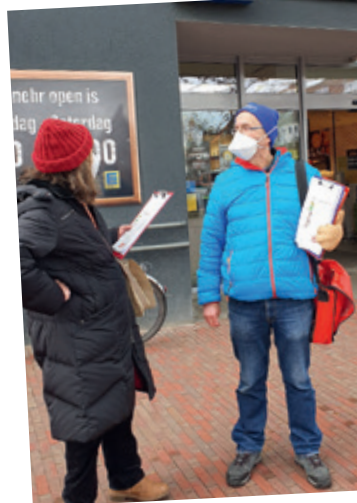
Beim Unterschriften-sammeln am Neuen Markt in Emden

Ich möchte Ihre Stimme bei der Bundestagswahl, weil das eine wirkliche Stimme gegen die bürgerlichen Parteien und gegen die AfD ist. Jede Stimme für mich unterstützt, dass wir uns zusammenschließen und für unsere Zukunft kämpfen!